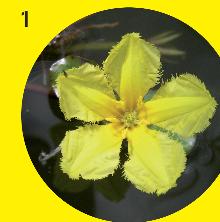
Nalezený vzácný Plavín šitrný (Nymphoides peltata)