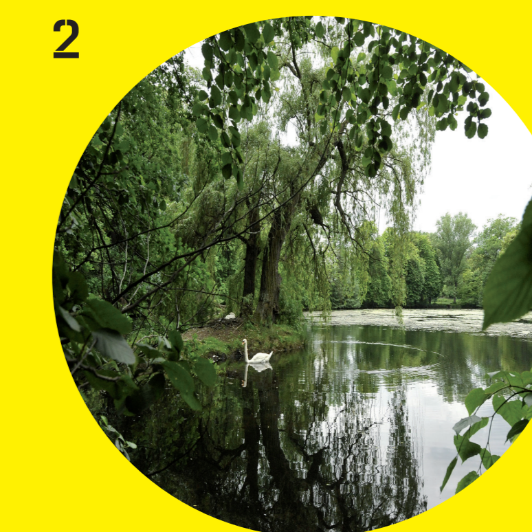
Rybník U Vodotoku